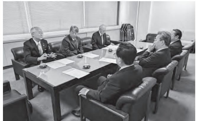
活性化議員連盟への要望風景

いきいき働くことができる「人を大切にする企業」づくりと、安心して暮らせる「人を大切にする社会」の実現を目指していきます。