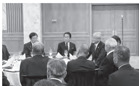
平田会長と国会議員の方々