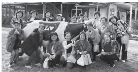
視察先のトムミルクファームにて

今回の視察を通じて、地域を知り、地域を活かす女性部の取り組みの重要性を改めて感じる機会となりました。