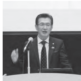
講師の蓼県連副会長

現在、県青連では、県内全商工会の今後の事業運営の羅針盤となる「青年部運営基本方針」を策定中ですが、今回学んだ内容や出された意見を反映し、時代の先端を行く青年部組織の実現に向けて取り組んでいく考えです。