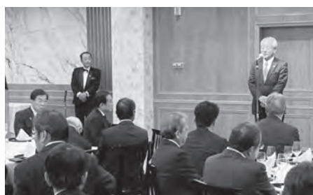
平田会長あいさつ