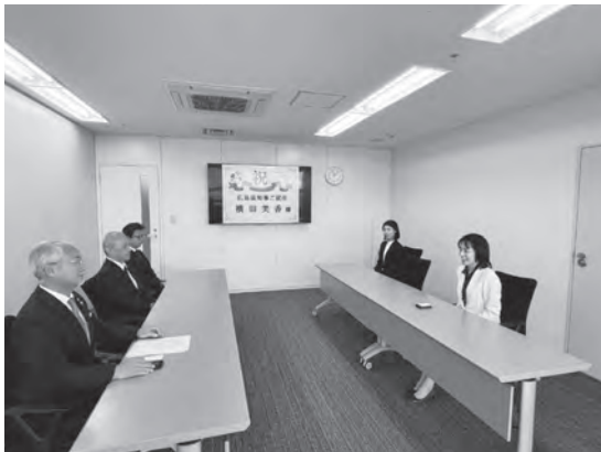
横田新知事の挨拶の様子