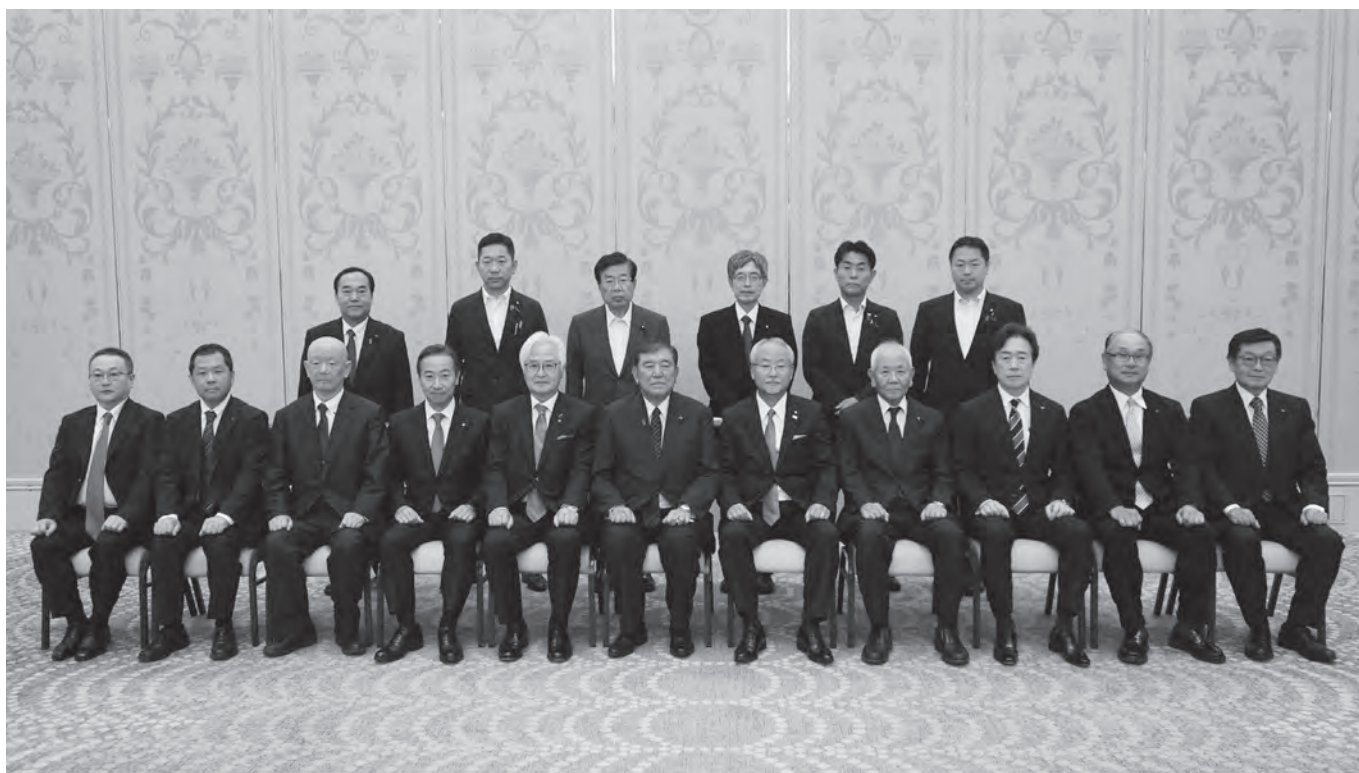
石破茂総理大臣と広島県産業界との日米関税合意を巡る意見交換会に出席