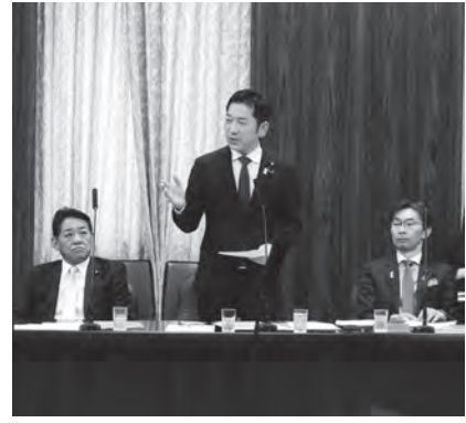
参議院 経済産業委員会

その運用基準を現場で理解しやすくすることも重要です。特に建設業では資材価格の高騰や手形払いの長期化など構造的な課題があり、国土交通省に対して支払条件の改善を求めています。私はこうした制度面の改善に加え、発注者と受注者が「対等な協力関係」として支え合う文化づくりも必要であり、法の名前を「下請法」から「協会社社支援法」といった前向きなものに改めてもよいのではないかと、そんな提案を昨年の臨時国会で行い、今年度の法改正で「下請法」を「中小受託取引適正化法」に、「下請業者」を「中小受託事業者」に改めることができました。