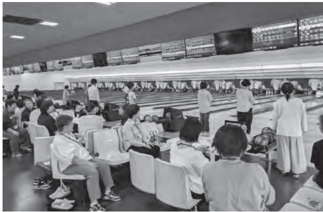
熱戦を繰り広げる参加者たち

県女性連では今後も部員の健康増進と交流の機会を提供し、組織強化に努めていきます。