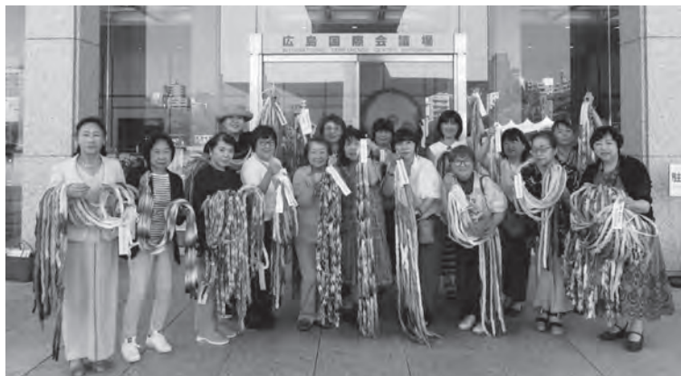
県女性連役員と各地から寄せられた千羽鶴

II. 中小・小規模事業者に対する伴走型の支援体制強化 ① 職員設置定数の充実並びに人材の育成等（継続・一部新規） ② 商工会の広域的指導体制への支援（継続） ③ 商工会館の防災強化（継続） ④ 商工会地域のDX化推進に向けた支援（継続・一部新規） ⑤ 小規模事業経営支援事業費補助金の維持及び物価高等への対応等（継続・一部新規） その後の意見交換では、急激な賃上げに伴う中小・小規模事業者の窮状や、商工会をはじめとした支援団体の体制強化の必要性について認識を共有すると共に、パートナーシップ構築宣言や改正下請法の周知徹底による更なる健全な取引の促進、人手不足を背景とした県外への若者流出防止対策や、外国人材の活用等について活発な意見交換が行われ、非常に意義深い会議となりました。