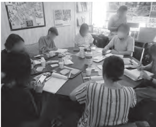
味や香り、パッケージなどの意見交換の様子

をしていいる場面や旅先で購入する場面などを想定して評価・感想がありました。事業者からは「普段使われる一般の方の直接的な意見が聞けたため商品の改良を行っていききたい」、「商品評価をいただき、商品改良を本格的に進める方向性を固めることができた」など、商品改良に前向きなコメントや、消費者等からの生の意見が参考になったと回答がありました。 図①は実施事業者に行ったアンケート結果をまとめたものですが、パッケージ、ネーミング等取り組みやすい点から事業者が改良を検討している事が読み取れます。しかし、商品の背後にあるストーリーは事業者自身では表現しにくい為、今後商工会や、専門家の支援が必要であることが考えられます。