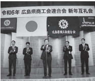
▲地元選出の国会議員(越智・石橋・平口・小島・新谷議員)