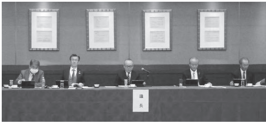
「令和5年度広島県商工会連合会臨時総会の様子」

した夢ぶらぎについて、売上も好調に推移しており、販路開拓のハブ機能を目指して事業に取り組んでいくことを説明しました。更には、県連会館の移設についても検討すべき事項と情報等を整理のうえ、具体的な協議に着手することを述べました。 最後に大きく変貌する経済環境の中で、商工会の活動をさらに強化できるよう、5年先10年先を見据え、取り組んで参りたいと出席者に協力を依頼しました。