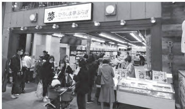
賑わう夢ぷらざの様子

令和5年度のひろしま夢ぷらざは、令和4年度に行った店舗リニューアルの効果に加え、令和5年5月に開催されたG7広島サミットを契機に連日多くのお客様で賑わった。G7サミット閉会后も来店客数は高い水準を維持し続け、リニューアルから一年が経過した9月以降も前年度比で10%増となっている。売上高については、令和5年度の総売上高の目標を4億5千万円と設定していたが、令和6年2月末時点でその目標を上回る4億6千万円となっており、令和5年度の総売上高は5億円を超える見込み。 特徴的なのは店内常設コーナー（商工会及び商工会議所コーナー、酒類販売の合計）の業績が絶好調で2月末時点で3億3千7百万円と開設以来最高の売上高となった。 売れ筋商品をカテゴリー別に見てみると、1位は菓子類、次いで乾物、そして惣菜となっており、1位の菓子類でもみじ饅頭の売れ行きが例年以上に好調で観光客の利用の多さが伺える。また、惣菜では比較的低価格の弁当や巻ずしに人気が集まっており、日常的に購入されるお客様が増えてきていることが伺える。 また、開設以来初めての取組みとして、消費者を巻き込んだレシピピコ