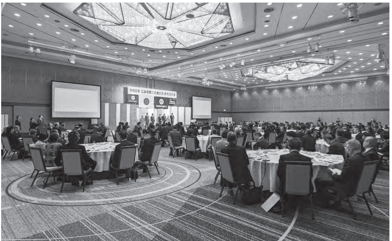
令和6年 新年互礼会