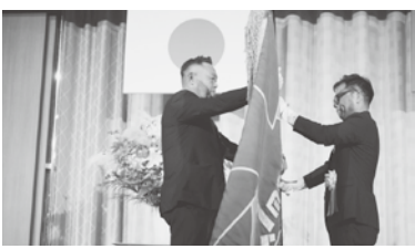
中国・四国ブロック商工会青年部連絡協議会会長から香川県青連会長への大会旗引継ぎ