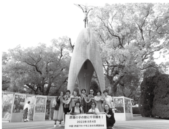
県女性連役員10名が原爆の子の像を訪れました

ブースに吊るされており、世界の皆様が平和を願っていることをより一層強く感じました。また、新型コロナウイルス感染症が第5類に移行し、日々の生活が元に戻りつつあります。世界の平和及びコロナウイルス感染症の完全な終息を祈りながら皆様の想いと一緒折り鶴を奉納させていただきます」と奉納の思いを語られました。 県女性連では次年度以降も変わることのない平和への祈りを届けていきます。