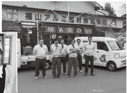
営業施工の従業員の皆さん

アリングでは、社長と店長から、事務作業の核となる受発注、見積請求、既存システムとアナログ部分の運用状況、現場工務担当との情報伝達方法について、話を聞き、問題点の洗い出しをしていきます。何から手を付けてよいのか分からなかった『事務作業の効率化』について、業務プロセスの見える化（マンダラート作成）から着手するという、事業者と支援者の『共通認識』としての切り口が見えてきたので、これら経営課題について、座学で学習した内容をもとに整理し、考え、提案し、その実行に伴走していきます。 「『DX』に関する経営相談も商工会へ！」と、すべての職員が胸を張って提案できる姿を思い描き、いざ、DXチャレンジ！