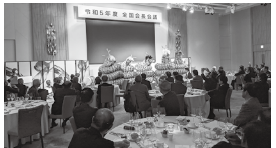
松原神楽団による上演

翌日の視察研修では、江田島市の海上自衛隊の第1術科学校ならびに幹部候補生学校を訪問。大講堂や将校本館、教育参考館などの見学を行いました。