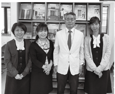
河村社長と奥様（左隣）と事務員さん