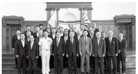
第1術科学校 大講堂にて集合写真