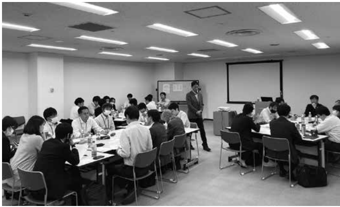
DX スキルアップ研修 OJT キックオフミーティングの様子