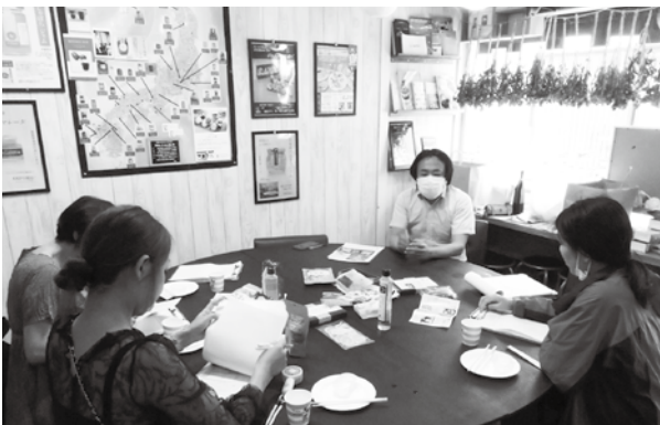
モニターのみなさんは、一つひとつの商品を丁寧に評価し意見交換を行いました

当連合会ではその他にも、改良した商品の販路開拓を後押しする「商談会」等の支援を行っており、各段階に合わせた事業者の商品開発・販促支援を進めていきます。