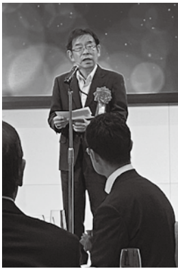
来賓挨拶(中国経済産業局 實國局長)

会議終了後の懇親会では、冒頭の歓迎アトラクションとして松原神楽団(安芸太田町)による「八岐大蛇」を上演。参加者に広島神楽の魅力を発信しました。