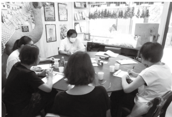
味や香り、パッケージなどを確認しながら、正直な意見をぶつけていました