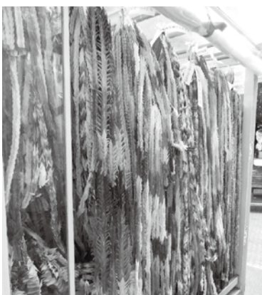
色とりどりの千羽鶴を一束一束丁寧に奉納しました