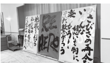
オープニングアトラクションで書かれた大会テーマ