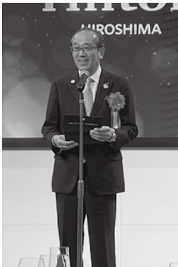
来賓挨拶(広島市 松井市長)