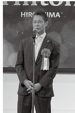
来賓挨拶(広島県 湯崎知事)