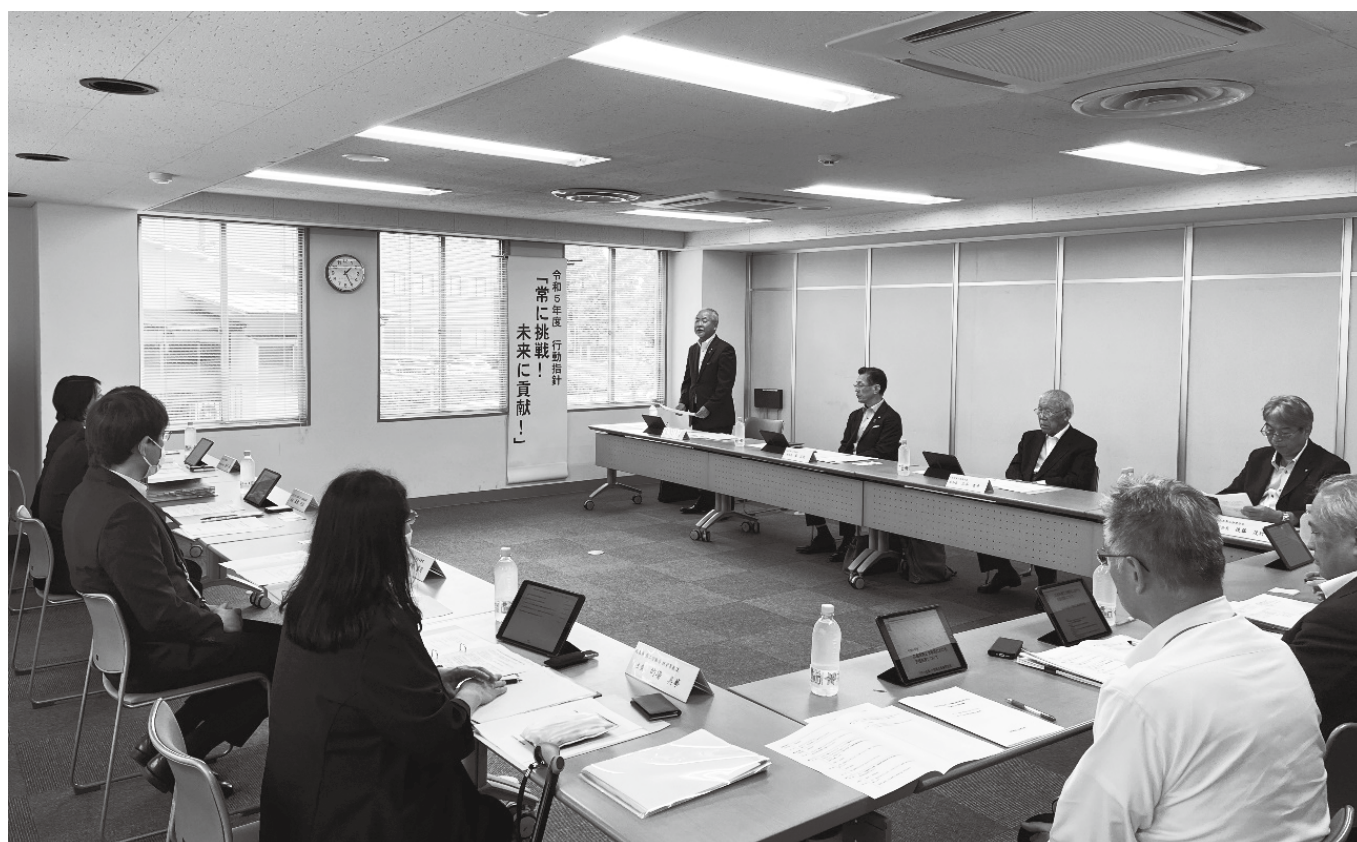
広島県中小企業・小規模振興条例個別会議