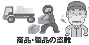
商品・製品の盗難