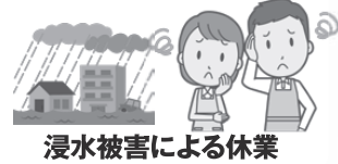
浸水被害による休業