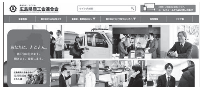
ホームページのトップページ

ら、WEBでの申込を行えるようになり、より多くの方の応募に対応できる体制を構築しました。今後、より多くの方々に商工会を知ってもらい、活用いただけるように情報発信を行ってまいります。