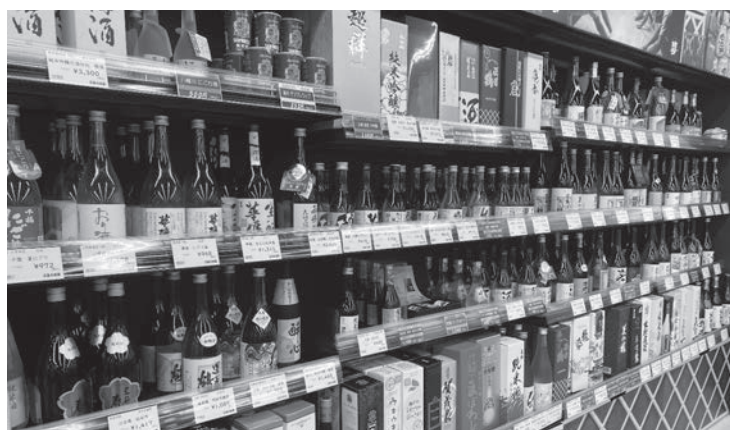
酒処ならではの品揃え酒コーナー

したのは、手作りのお弁当やお惣菜コーナー。お土産が中心だった商品ラインナップにデイリー使いできるお弁当、お惣菜、パンやサンドイッチを加えることで、さらに幅広いお客さまの利用を目指します。