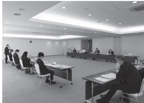
広島県中小企業・小規模振興条例個別会議

題を県と共有するとともに、支援策の要望ができた非常に意義深い会議となりました。今後も、商工会及び中小・小規模事業者の声を伝えていく場として、次年度以降も開催していく予定です。