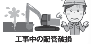
工事中の配管破損