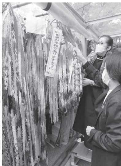
4万5千羽の千羽鶴を一束一束、丁寧に奉納しました

きましたが、改めて、この事業が中国・四国ブロックの女性部の皆様との共同事業であるという認識とともに、皆様の代表として、世界の平和と新型コロナウイルス感染症の終息を祈りながら奉納させていただきました。県女性連では、今後も折り鶴奉納事業を継続して実施する予定です。」と話しました。 コロナ禍においても県内外の多くの女性部の皆様にご協力いただき、今年度も本事業を実施することができました。県女性連では次年度以降も変わることのない平和への祈りを届けていきます。