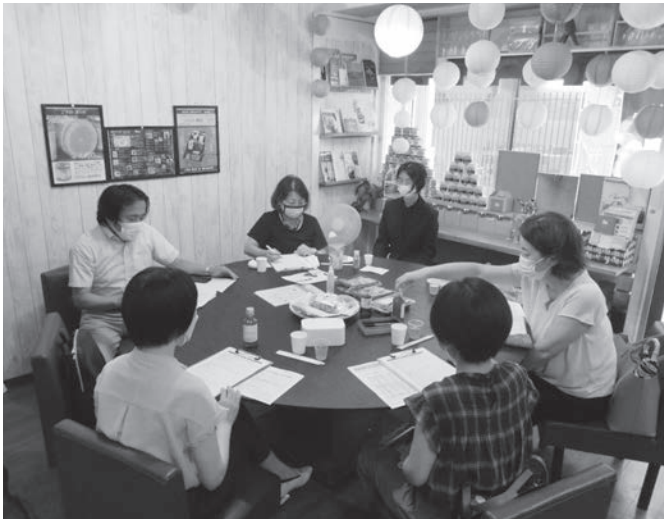
モニターのみなさんは、一つひとつの商品を丁寧に評価し意見交換を行いました

具体的な評価項目は、「食感・舌触り」「食べやすさ」「風味・香り」「デザイン」「使いやすさ」「ネーミング」「価格」の8項目としました。また、モニターの中でデイスカッションも行われ、一般消費者のモニターからは「お弁当にも使えそう」「お土産用なら瓶入りにして高級感を出してほしい」「希釈倍率を一目で分かるようにしてほしい」など利用シーンを意識した使いやすさや価格帯など消費者視点の率直な意見を聞くことができました。今回いただいた意見はレポートにまとめ、各事業者と所属商