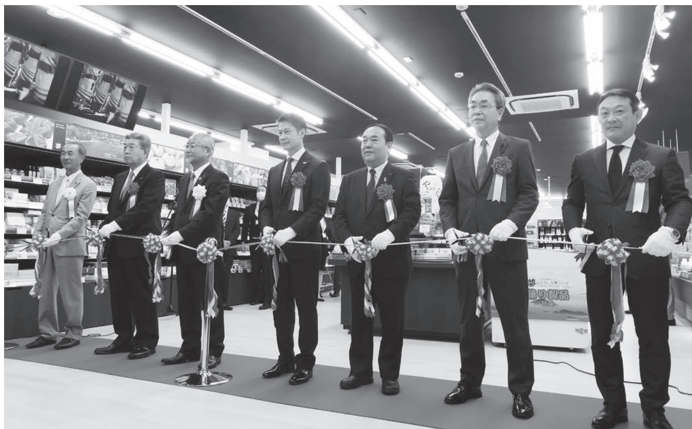
ひろしま夢ぶらざりリニューアルオープン