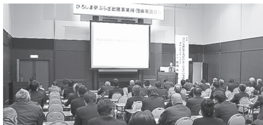
ひろしま夢ぷらざ出店事業所・団体等講習会風景

今や当たり前。消費者目線で、買いたくなる商品を作っていくことが大切」と前置きした上で、ラベルを貼る場所やキャップの色、包装方法、商品の詰め方など、自社の直営店で取り扱う商品を事例に上げながら、ちよとしたポイントで買いたくなる商品へ生まれ変われることを一つひとつ説明を行いました。