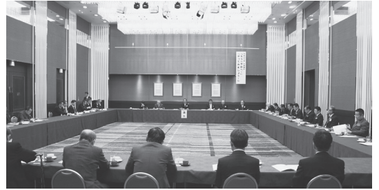
5つの議案について審議が行われました

第三号議案 平成二十九年年度 県連 合会会費賦課基準(案) 及び徴収 方法(案) 承認の件 第四号議案 平成二十九年年度 電子 計算機処理手数料賦課基準(案) 及び徴収方法(案) 承認の件 第五号議案 平成二十九年年度 借入 金最高限度額(案) 及び借入先承 認の件