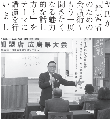
講演する橋本テツヤ氏

開会のあいさつで県連の石井正朗専務理事は、「広島県商工会連合会の商業対策の柱でもある「ぽっぽカード事業」は、来年度で節目の二十年を迎えます。各商工会の経営指導員による巡回指導を強化し、持続化補助金をはじめとする各種施策の普及や活用した専門的な指導による課題解決などを通じた個店のレベルアップ等に力を注ぎ、地域から支持され、利用されるポイントカードをめざして事業を実施していきます」と挨拶しました。続いて行われた講演会では、ジャーナリストでコラムニストの橋本テツヤ氏が、