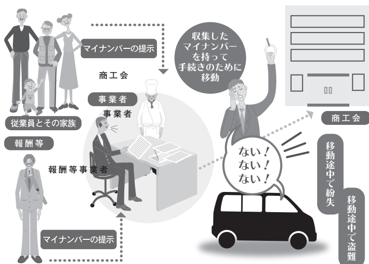
従業員とその家族のマイナンバーを守る安心システム

貴社では、諸手続きや各種の支援を受ける為に、商工会に来訪する事が多々あると思います。しかし、その都度、従業員や扶養家族を含めた個人番号を持ち運ぶことになり、持参を忘れて、重要書類の紛失・盗難のリスクが増える事になります。