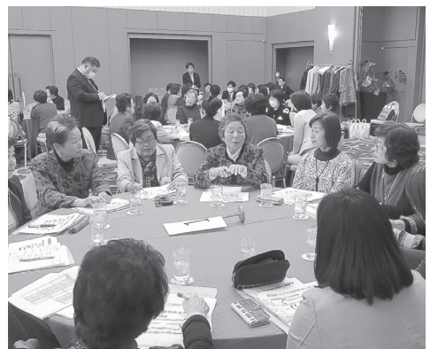
活発な意見交換が行われたグループディスカッションの様子

その後、これまで全国の各商工会女性部が行った五つの部員増強の取り組みを紹介し、「これからの女性部」に求められているのは、売手人としての厳しい目と若者への温かい気持ち、地域を愛する気持ちです」と述べ、「女性の凄いパワーを今後地域で活かしてほしい」と締めくくりました。