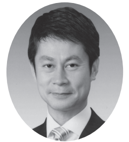
広島県知事 湯崎 英彦

あけましておめでとうございます。平成三十年の新春を迎え、県民の皆様にご挨拶を申し上げます。