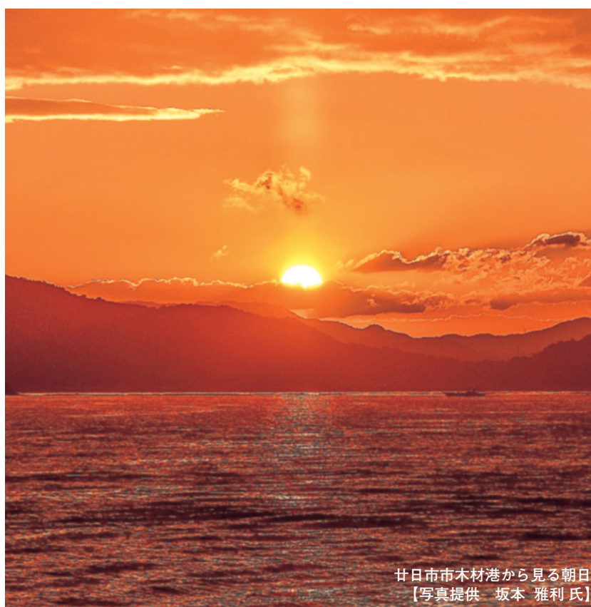
廿日市市木材港から見る朝日