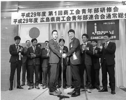
越智会長から植田新会長を始めとする第20代新役員へ

・女性青年部員新規加入数の部(江田島市・福山北・上下町) ・若手部員(二十代)新規加入数の部(五日市)