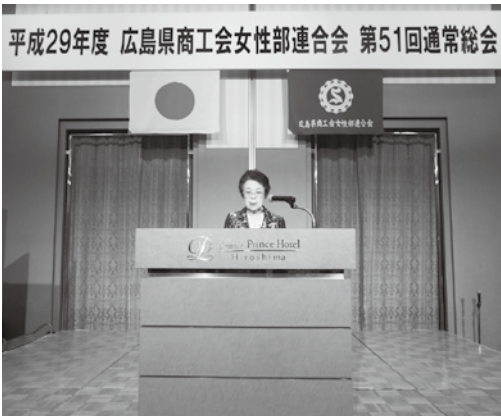
通常総会では、3つの議案について審議が行われました

場は大きな笑いに包まれ、大きくうなずく人の姿も見られました。講演後には、会場から多くの質問が出されるなど、充実した研修会となりました。