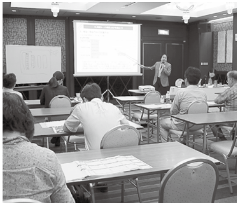
セミナーでは商品の魅力を伝える方法と種類を学習

発・販売に向けた一連のノウハウについて学びました。 また、7月18日(水)には、セミナーに参加した事業者に対する個別相談会を開催。専門家のアドバイスに熱心に耳を傾けながら、魅力的な商品開発へのヒントをつかんでいたいただきました。 来年度も、アンケートでの意見を参考にしながら、より充実したセミナーを企画する予定としています。