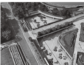
ひろしま産業展の会場となる県立総合体育館「サンクンガーデン」

商工会青年部全国大会では、ひろしまの魅力を様々な形で伝えるべく、「ひろしま産業展」という展示会を行い、飲食・物販・ものづくり・チャレンジという4部門から、30社の商工業者が自社の商品を展示・販売・PRするブースを構えております。大会公式ホームページには詳細な会場レイアウトの他、出展業者のプロフィールが掲載してありますので、ぜひ一度アクセスしていただき、会場に足を運んでいただければと思います。