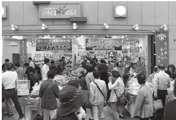
開設20年目を迎える「ひろしま夢ぷらざ」は、連日多くのお客様で賑わいました

の協賛商品特別価格で販売。更に企業協賛による店内一部商品感謝価格で提供する等、店頭・店内はお客様で大いに賑わいました。 10月17日(水)からマツダスタジアムで行われたCSファイナルステージでは、読売ジャイアンツを破り、日本シリーズへの進出を決めました。県民・鯉ファンはCS突破の健闘を称えるところにも、必ず日本の栄冠を掴んでくれることを信じて、選手へ感謝を含めたエールを送りました。