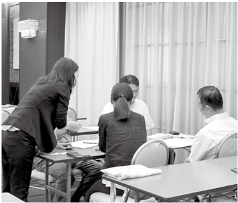
受講者たちは、本番さながらの模擬商談で自社商品の魅力を訴えていました

3回のセミナーでは、商品開発を行う前のストーリーづくりの重要性や商品の魅力的な魅せ方、商品の魅力を有効的に伝えるポイントを、事例を交えながら解説するとともに、コンセプトシートや商品カルテの作成を行い、参加者同士で事業者とバイヤーに分かれ、本番さながらの実戦形式での模擬商談などのワークショップを行い、魅力的な商品開