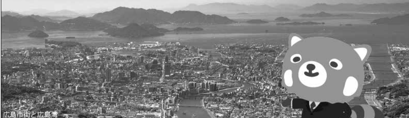
広島市街と広島湾