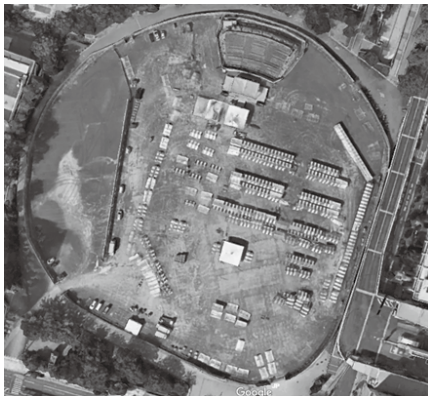
大懇親会の会場となる「旧市民球場跡地」

旧市民球場跡地で行う大懇親会では、北広島町上本地神楽団によるパフォーマンスを行います。神楽は通常裏方の動きを見せないのが本来の形ですが、今回はステージを会場中央に設置し、裏方の動きも見てもらうこともパフォーマンスの一つとして位置付けております。また、広島名物の牡蠣汁やビンゴフィッシュ（広島県東部・備後地域の漁師1、000人に選ばれた25種の魚「備後フィッシュ」を使用）をウエルカム汁として入口でお出迎えいたします。その他にも広島島のソウルフードであるお好み焼きや神石牛など、広島を感じていただける青年部屋台を11カ所構え、さらに比婆牛を使ったBBQによって、全国から集まる青年部員の方々をおもてなしいたします。ひろしま産業展と同じく、大会公式ホームページに会場レイアウトと出展屋台のプロフィールが掲載してありますので、アクセスしてみてください。