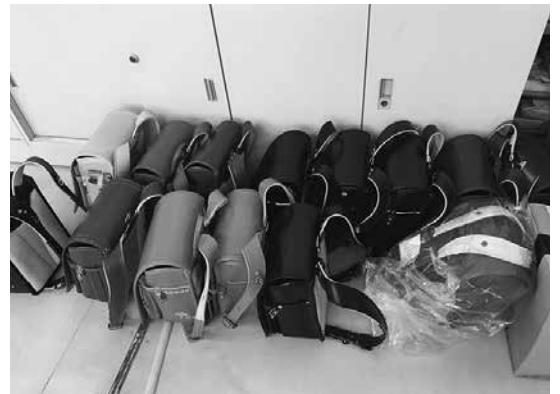
青年部ネットワークにより集まったランドセル133個を被災地域へ寄付

今回の豪雨災害には、国から政策パッケージとして、広島県中小企業等グループ施設等復旧整備補助事業、被災地域販路開拓支援事業（小規模事業者「持続化補助金」）が用