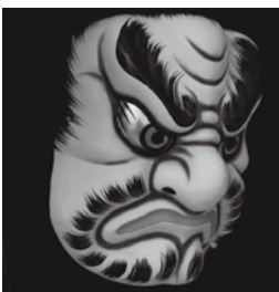
北広島町・前河氏が立ち上げた事業「面処 前河屋」で作成されたお面