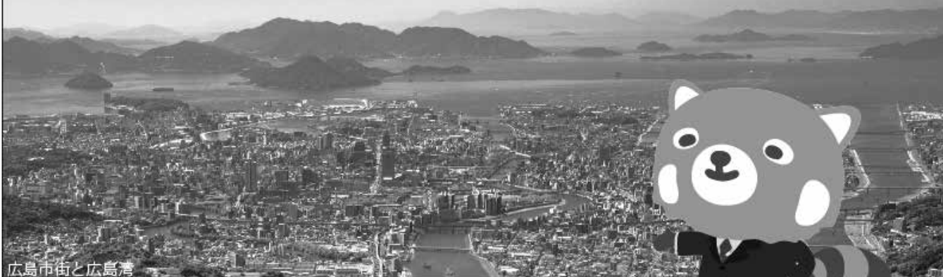
広島市街と広島湾