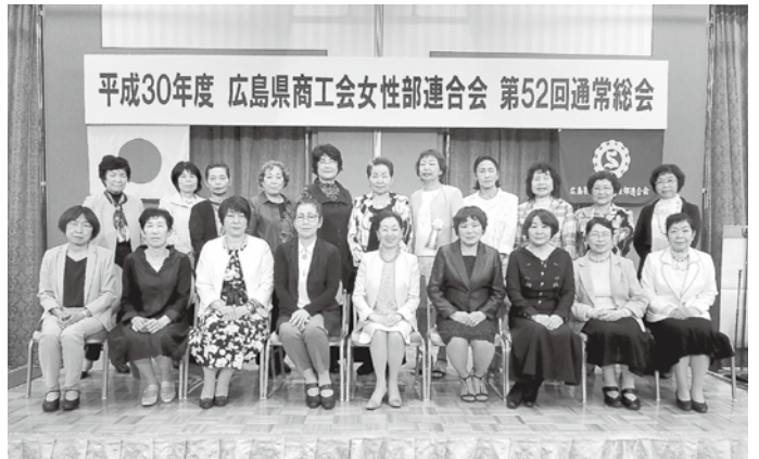
作田新会長(1列中央)と新役員のみなさん