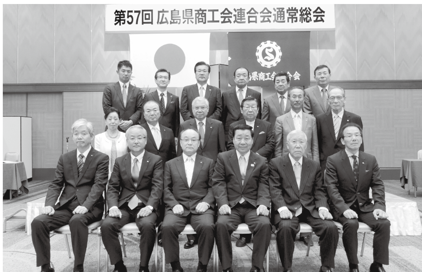
第57回 広島県商工会連合会通常総会

第57回県連通常総会で選任された、新役員18名(各列左より) 任期:平成30年5月30日~平成33年5月29日