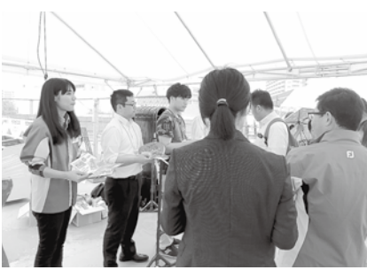
オリジナルうちわの配布で商工会と夢ぷらざをPR