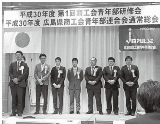
部員増強表彰を受けられた一同