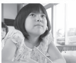
子どもの教育資金