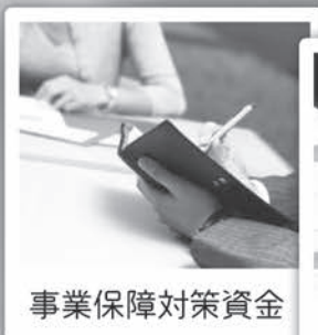
事業保障対策資金