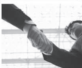
事業承継対策資金