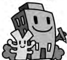
経済センサスキャラクター