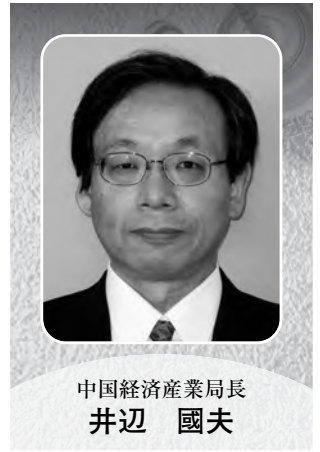
中国経済産業局長 井辺 國夫