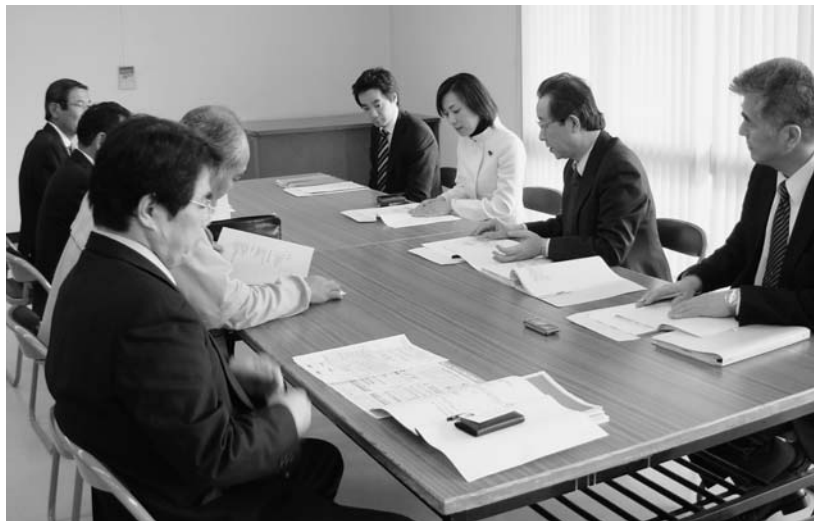
沼田町商工会事務局での視察の様子

“ネットde記帳”が採用される見込みであることから、その普及件数が全国トップの沼田町が視察の対象地域に選ばれました。