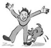
犬にかまれケガをした。