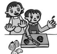
誤って包丁で指を切ってケガをした。