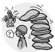
積んであった資材が落下してケガをした。