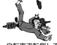
自転車で転倒してケガをした。