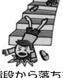
階段から落ちて骨折した。