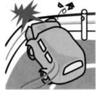
運転を誤りガードレールに衝突してケガをした。