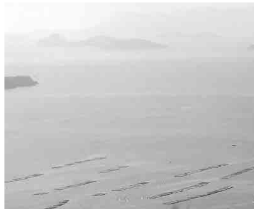
美しい瀬戸内海とカキ筏