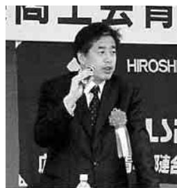
スポーツジャーナリスト二宮清純氏