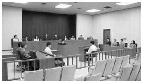
裁判員の参加する裁判用のモデル法廷 (最高裁判所において検討中の一案です。)

平成21年5月までに始まるこの制度は、国民の皆さんのご協力がなくては成り立たない制度です。今年、全国各地で行われる憲法週間記念行事においては、裁判員制度を国民の皆さんに理解していただくための催しも企画されています。是非ご参加いただき、裁判や裁判員制度について知るための機会にしていただきたいと思います。催しについては、最寄りの裁判所に直接問い合わせいただくか、裁判所ホームページ( http://www.courts.go.jp/ )の各地の裁判所のホームページから最寄りの裁判所を選択し、「お知らせコーナー」をご覧ください。