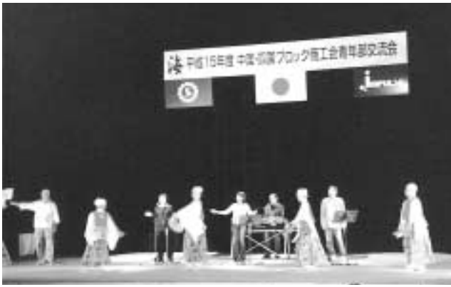
▲ オープニング「よさこい踊り」