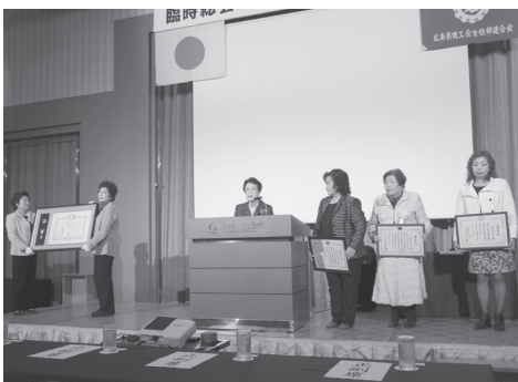
表彰者と表彰者が壇上に上がり、賞状が披露されました