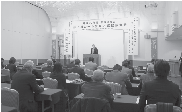
ぽっぽカード加盟店広島県大会

一月二十日(水)、ホテルセンチュリー21広島(南区の場町)にて『平成二十七年年度広域講習会 ぽっぽカード加盟店広島県大会』を開催しました。ぽっぽカード加盟店の代表など四十名が、二名の講師による講演会やぽっぽカード事業の概