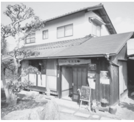
吉備野工房ちみち

講師は、昨年に引き続き、島根を拠点に、中国地域で広く、コミュニティビジネスの立ち上げやコンサルティングの多数実績を有している、株式会社シーズ総