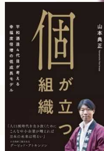
著書：個が立つ組織

1978年生。京都大学卒業後、人材系ベンチャー企業を経て、実家和歌山の酒蔵に入社。4代目として伝統的な酒蔵の組織・人材改革を手がけ、大量生産の紙パック酒製造から自社ブランド酒の開発・販売へと軸足を転換、業績を伸ばす。代表銘柄に日本酒「紀土」、リキュール「鶴梅」、クラフトビール「平和クラフト」等。「紀土」は堀江貴文氏が手がける宇宙事業でロケット燃料として提供、中田英寿氏とのコラボ商品開発など、日本酒の新たな可能性を広げる様々なチャレンジにも注目が集まる。著書に『ものづくりの理想郷』『個が立つ組織』