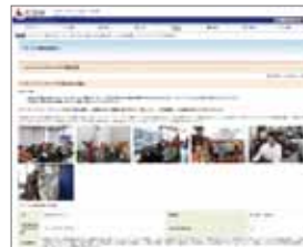
ホームページ（※イメージ図）

認定企業は商工会議所、商工会、県など関連機関のホームページのほか、様々な媒体を通じPRを図っていきます。