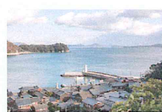
大塚下島新学校前から、しまかみ展望を撮影